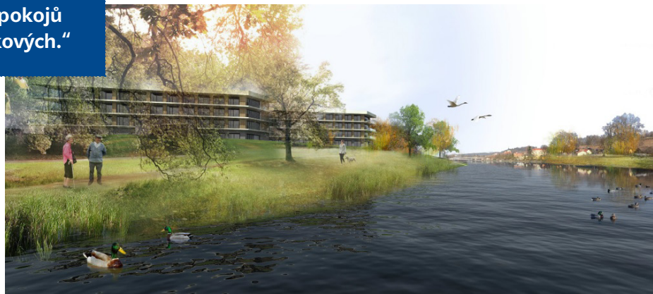
Vizualizace Centra pro seniory podle návrhu JPS J. Hradec s.r.o.

„Projekt původně počítal s převahou jednolůžkových pokojů, investor nabízí většinu pokojů dvoulůžkových.“